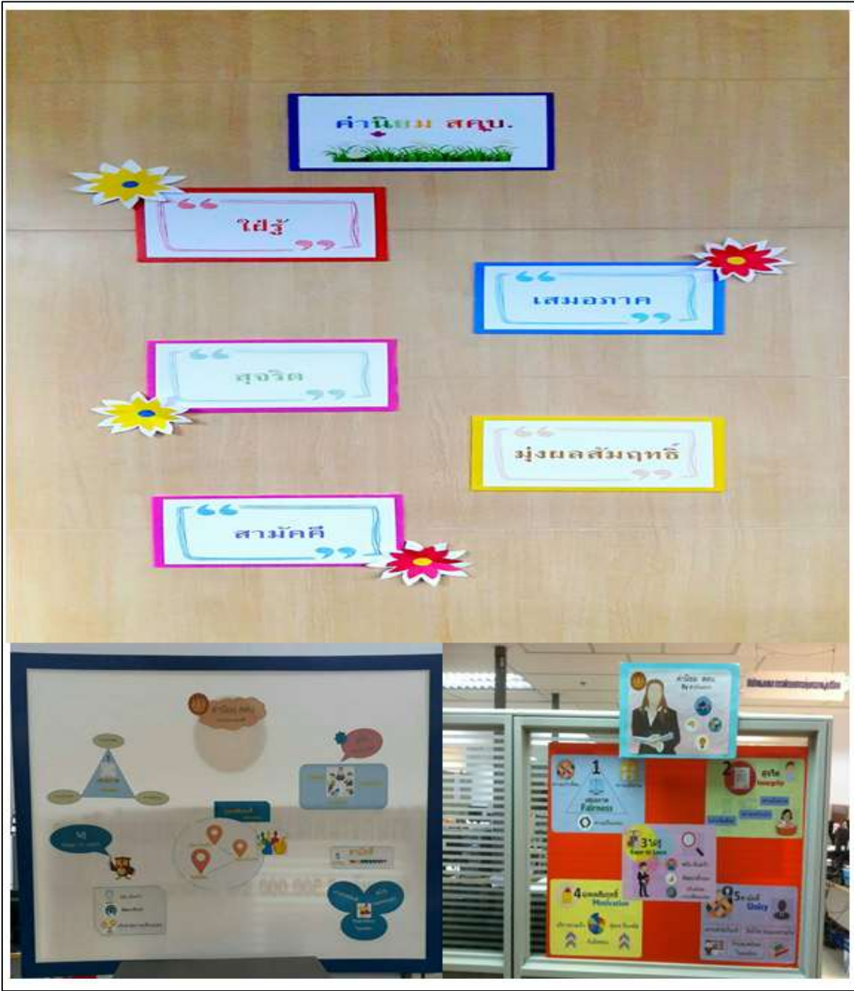
๔. ป้ายคำนิยมองค์กรในพื้นที่ต่าง ๆ